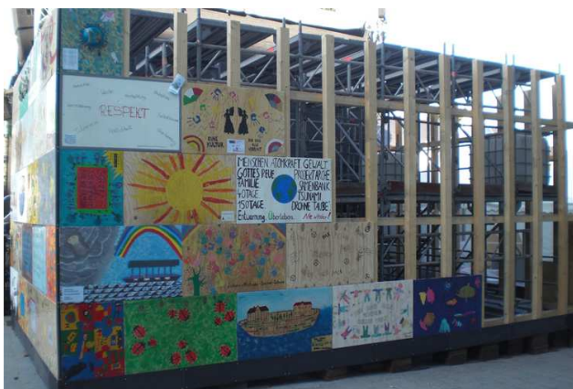
(Arche im Bau 2013)

Gemeinsam können wir mit der Arche 2.014 zum Ausdruck bringen, dass nicht