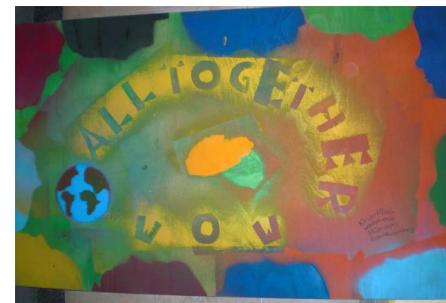
(Planke des Kinderbibelwochenendes)

Aus unserer Gemeinde beteiligten sich die Kindertagesstätten, die Frauengemeinschaften und das Kinderbibelwochenende (KIBIWO) mit gestalteten Planken an der Arche.