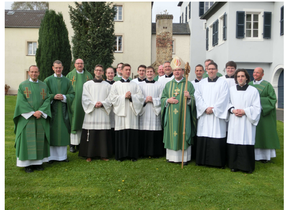
(Weihbischof Schepers mit Konzelebranten und den neuen Akolythen)

Weihbischof Ludger Schepers ermutigte mit diesen Worten die zehn Priesteramtskandidaten, die er in einen festlichen Gottesdienst im Spätberufenenseminar St. Lambert mit dem Akolythatsbeauftragten beauftragte. Diese Beauftragung ist ein Schritt auf dem Weg zum Priesteramt und entspricht der Sendung eines Kommunionhelfers. In seiner Predigt ging Weihbischof Schepers vom Doppelgebot der Gottes- und Nächstenliebe aus, welches am letzten Sonntag im Evangelium verkündet wurde. Er erinnerte daran, dass in der Heiligen Schrift die Aufforderung, keine Angst zu haben, oftmals im Zusammenhang mit Berufungen und Gottesbegegnungen erscheint. Gott und den Menschen nahe zu sein, Vertrauen zu schenken, helfend zur Seite zu stehen, dies seien Aspekte der Berufung.